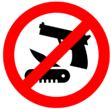
Verbot von Waffen aller Art