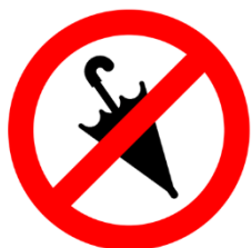
Verbot von sperrigen Gegenständen