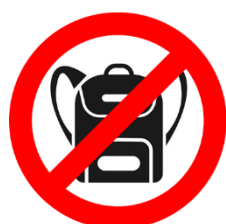
Verbot von Taschen über A4