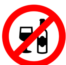
Verbot von Glas