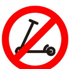
Verbot von E-Scootern/ Segways