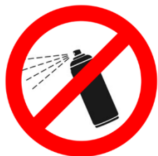
Verbot von Sprühdosen