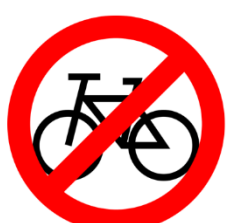
Verbot von Fahrrädern/ Skateboards